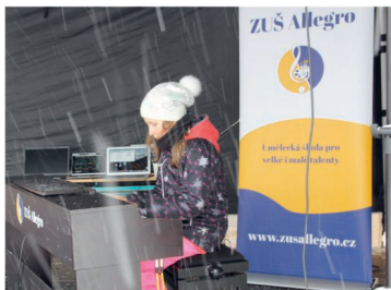
KLAVÍRNÍ VYSTOUPENÍ ZUŠ ALLEGRO