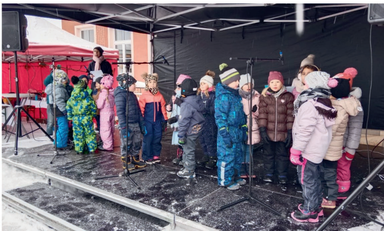
VYSTOUPENÍ DĚTÍ Z MŠ