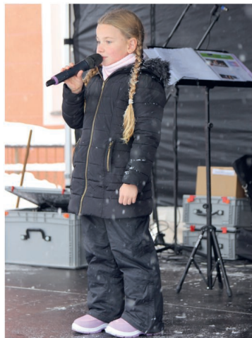
PĚVECKÉ VYSTOUPENÍ ZUŠ ALLEGRO