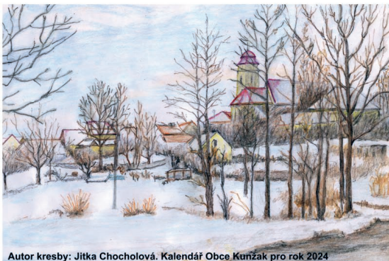
Autor kresby: Jitka Chocholová. Kalendář Obce Kunžak pro rok 2024

Rok 2023 se přiblížil ke svému konci, přichází čas adventní a s ním nejkrásnější svátky v roce. Přeji Vám klidné a příjemné chvíle, plné domácí pohody, radosti, lásky a dobré nálady. Úspěšný a šťastný rok 2024, naplněný zdravím, přátelstvím a životním optimismem.