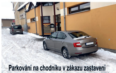
Parkování na chodníku v zákazu zastavení

vozidlo komplikovat průjezd větších vozů, záchranných složek, znemožňovat svoz komunálního odpadu a práci údržby obce. Parkujte na místech k tomu určených!!!