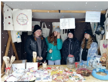
STÁNEK S VÝROBKY DĚTÍ ZE ZŠ