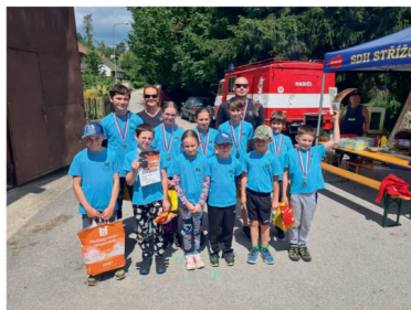
23.6. Hasičské závody - Střížovice (JHHL)