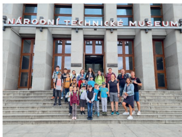
15.6. Návštěva Národního technického muzea Praha (mladí hasiči)

26.10. Výlov Housarského rybníku + prodej ryb