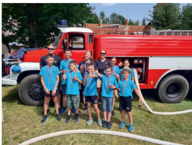
29.6. Hasičské závody - Mosty (JHHL)