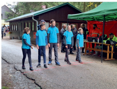
5.10. Okresní kolo ZHVB - Kolektiv mladých hasičů - Osika