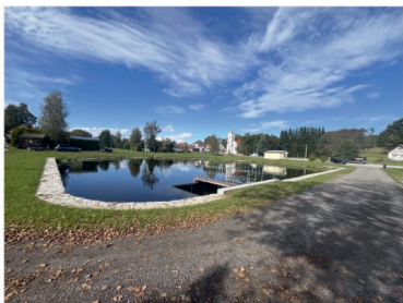
Valtínov rybník na parc. 32/1